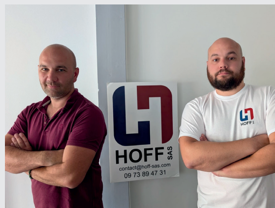
Hoff Sas - Travaux publics Sonnaz