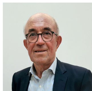
Pierre Sirodot président du tribunal de commerce de Chambéry

D'autres procédures, plus longues, telles que l'assignation en référé ou l'assignation au fonds, sont nécessaires lorsque le bien-fondé de la créance est contesté par le débiteur. »