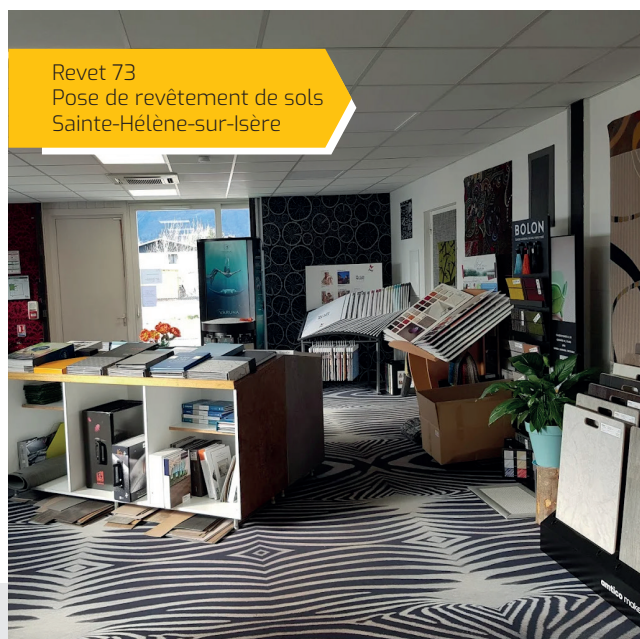
Revet 73 Pose de revêtement de sols Sainte-Hélène-sur-Isère